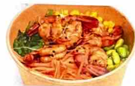
Poke Ball Crevettes