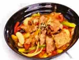
Bœuf sauté sauce Thai