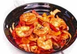
Crevettes sauce Thai