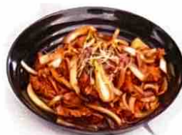
Bœuf sauté aux Oignons

Merci de ne pas jeter sur la place sur la voie publique