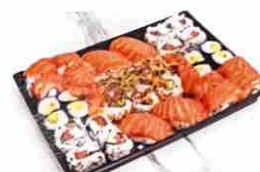
Plateau de 40 pièces

N'hésitez pas à nous suivre sur les réseaux sociaux pour les nouveautés ou à laisser un commentaire !!!