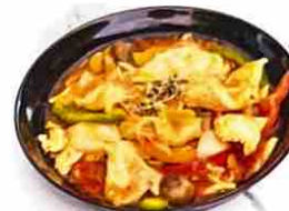
Poulet sauté au Curry